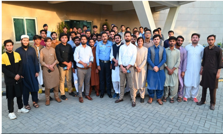
IIUI students delegation visited the Central Police Office & met IGP