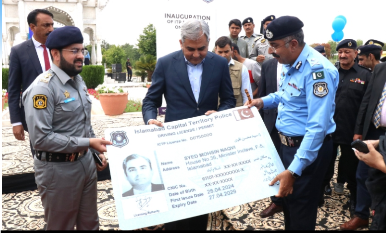
Federal Interior Minister inaugurated mobile facilitation and education service