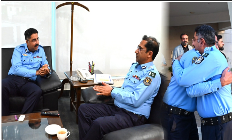
Farewell ceremony held in honour of outgoing DIG Security Division