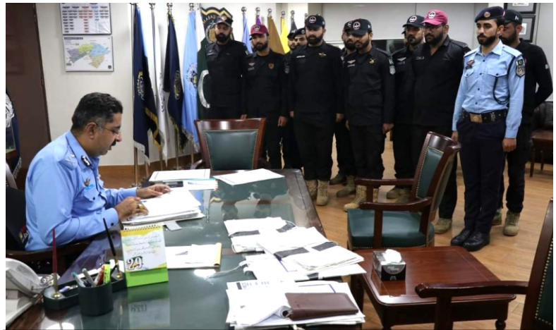
IG Islamabad holds orderly room; to address the concerns of officials