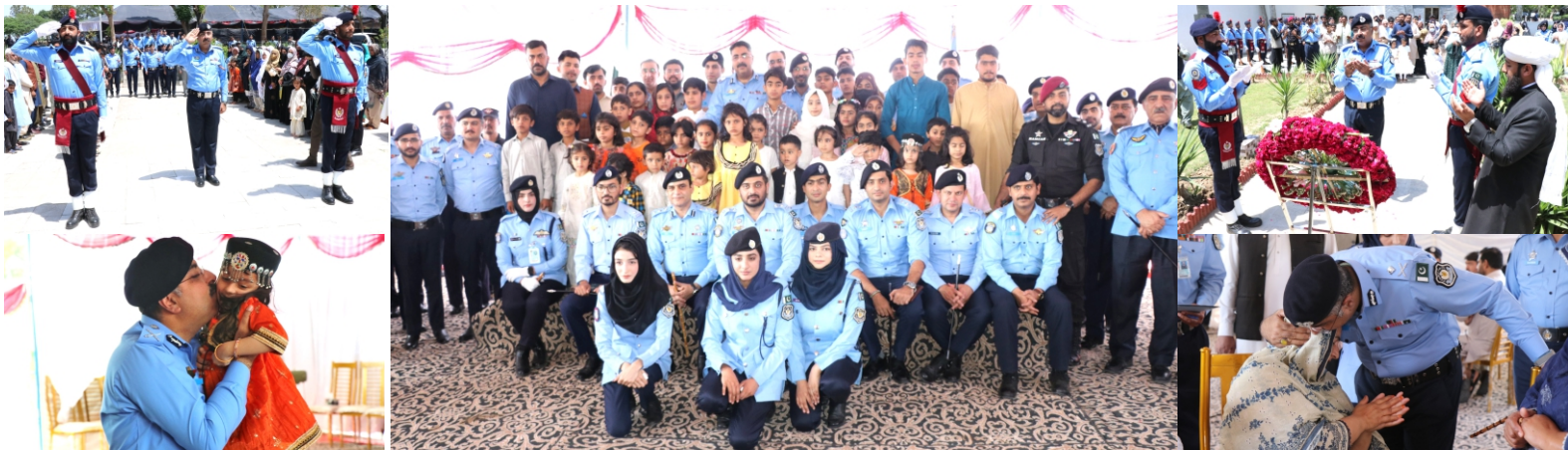
A dignified ceremony was held at the Police Lines Headquarters Islamabad in honor of the families of Islamabad Police martyrs