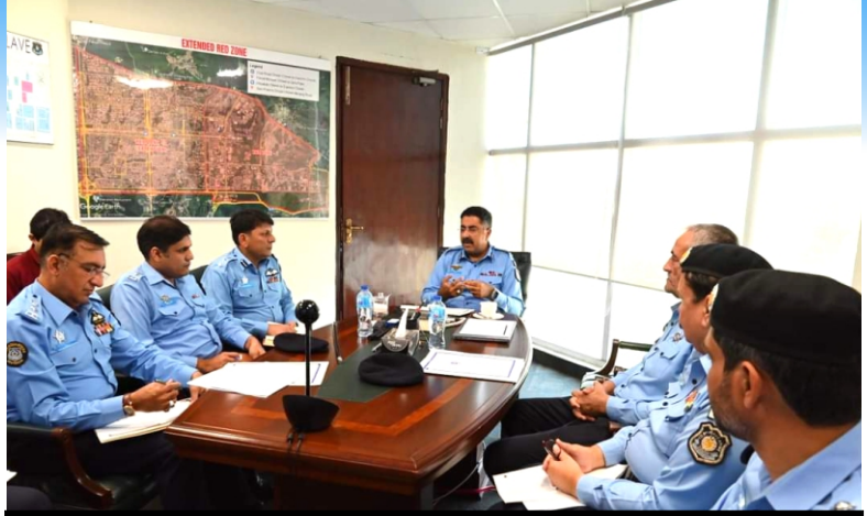
IGP Islamabad holds meeting with CIA senior officers