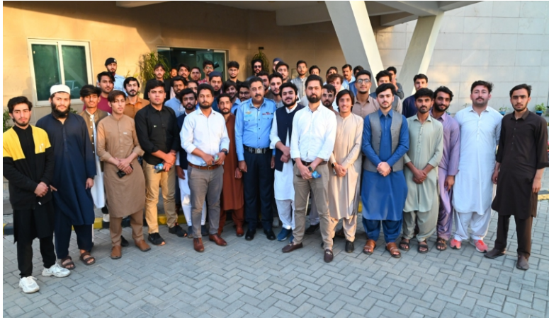
انٹرنیشنل اسلامک یونیورسٹی اسلام آباد کے شعبہ پولیٹیکل سائنس کے طلباء کا سنٹرل پولیس آفس کا دورہ