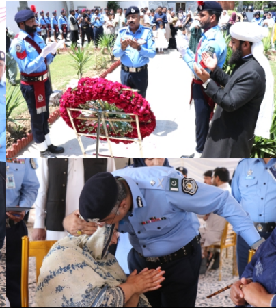
اسلام آباد پولیس کے شہداء کے اہلخانہ کے اعزاز میں پولیس لائسنس انٹرنیٹ کوارٹرز میں پروقار تقریب کا انعقاد کیا گیا