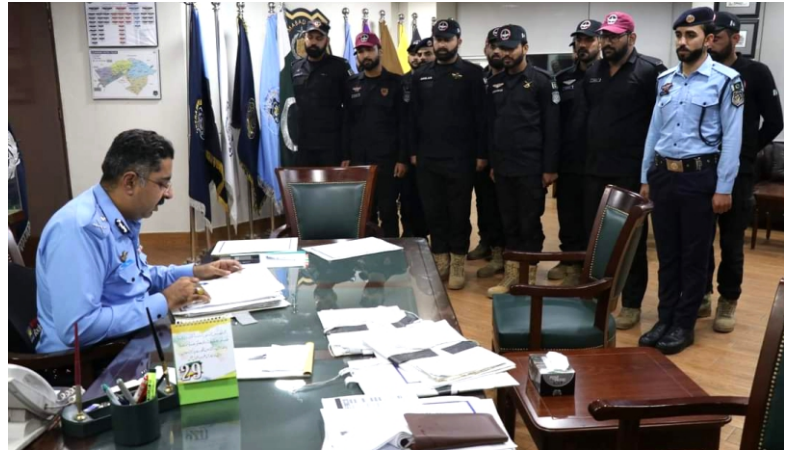
آئی جی اسلام آباد کا پولیس کے افسران کو درپیش محکمانہ اور ذاتی نوعیت کے مسائل کے حل کیلئے سی پی او میں اردل روم کا انعقاد