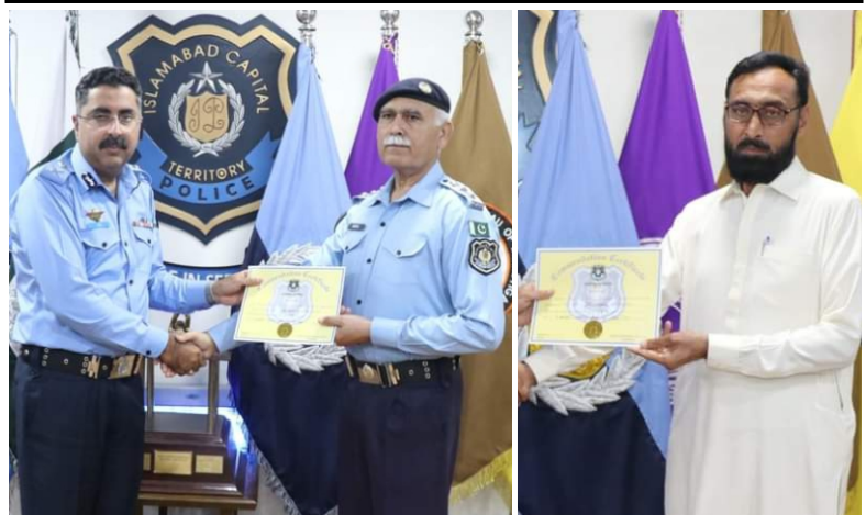
IGP awards commendation certificates, cash prizes to officers for outstanding performance