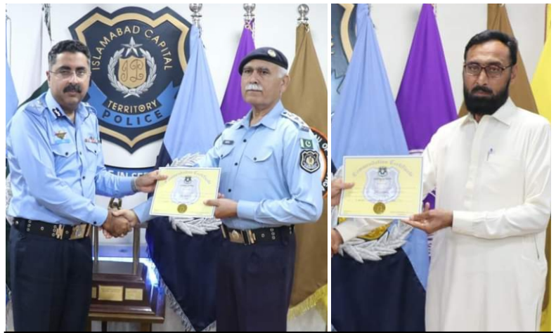
آئی جی اسلام آباد نے اچھی ڈیوٹی سر انجام دینے پر پولیس افسران کو شاباش دی اور تعریفی اسناد سے نوازا